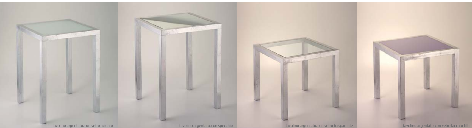
tavolino argentato, con vetro acidato